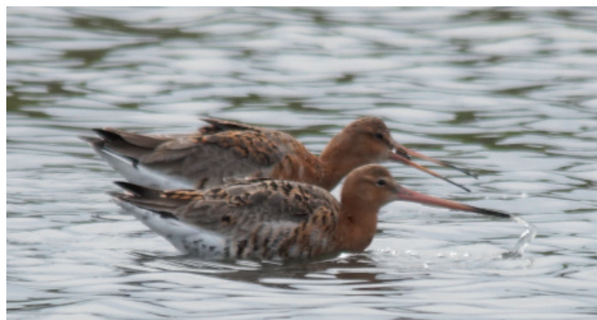
Barges à queue noire

C'est dire si cet été 2015 est loin d'être un oasis de rêve dans un monde sans problème. La belle saison est cependant une période propice aux découvertes, aux rencontres, à l'enrichissement culturel. Nous souhaitons à tous nos lecteurs une très agréable période estivale et vous donnons rendez-vous à la rentrée.