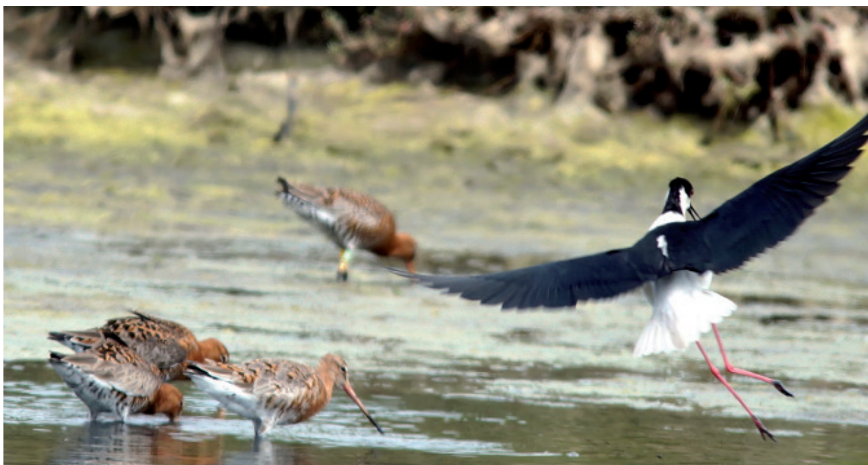
Echasse s'envolant devant des barges à queue noire

Ces élections sont pour nous importantes car elles sont le gage de notre volonté de démocratie.